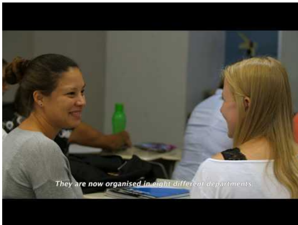
Vidéo : Site web Jumelages interculturels

Selon Nicole Carignan, les problèmes d'adaptation des immigrants ont longtemps été considérés comme étant de leur propre ressort, portant seuls le poids de l'échec ou du succès de leur intégration à la société d'accueil (citée par Caza, 2014). Or, la pratique des jumelages interculturels montre que cette intégration peut aussi dépendre des efforts de la majorité d'accueil.