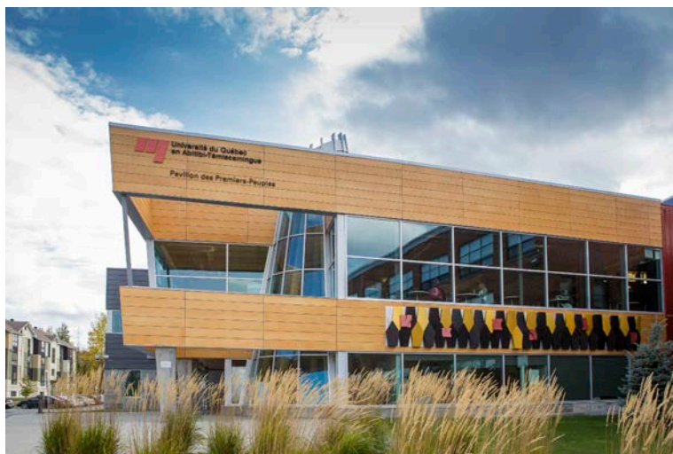
Pavillon des Premiers Peuples, UQAT, Val-d'Or

L'approche holistique exige une grande polyvalence de la part des professionnels qui soutiennent et accompagnent les étudiants pendant leurs parcours universitaire. L'équipe du Service Premiers Peuples offre un service personnalisé à l'ensemble des étudiants du campus de Val-D'Or, mais elle a aussi développé une expertise qui permet de répondre aux besoins spécifiques des étudiants des Premiers Peuples sur les plans scolaire, familial, social et culturel, et ce, dans un environnement culturellement sécurisé (voir Notion clé du dossier).